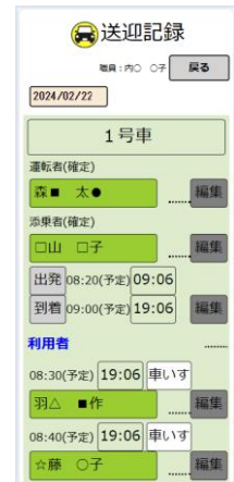
送迎画面 (スマートフォン)